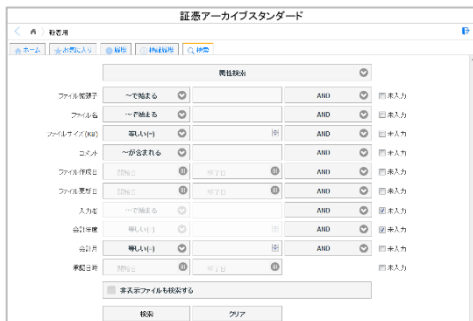
検索画面 未入力検索が可能です