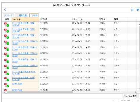
検証結果画面 ファイル出力機能搭載