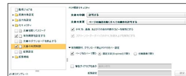
文書の様々な利用制限の設定

●パスワード機密保護機能 RSA RC4 40/128 ビット、AES 128 ビットの暗号化 PDF をサーバーで自動生成することができます。設定するパスワードは監視フォルダー毎に変更することができます。クライアントソフトで、個人別に設定する必要がないので、プロジェクト等のグループ限定のパスワードを設定して、セキュアに文書を共有する等の運用が簡単にできます。今回新たに、権限パスワードをランダム設定する機能を追加したので、より安全に暗号化 PDF が運用できます。