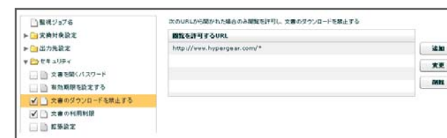
閲覧を許可する URL を指定

注 1)より高度な DRM 暗号化ファイルの生成、運用が可能な HGScanSECURE5 もラインナップしています。