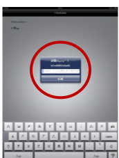
ログインパスワード