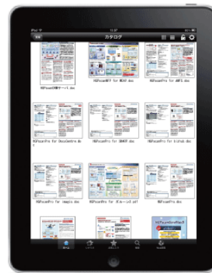
フォルダサムネイル