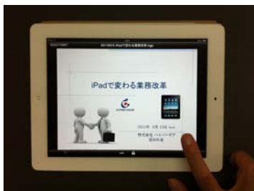
(HGViewLT パブリッシャーが必要)